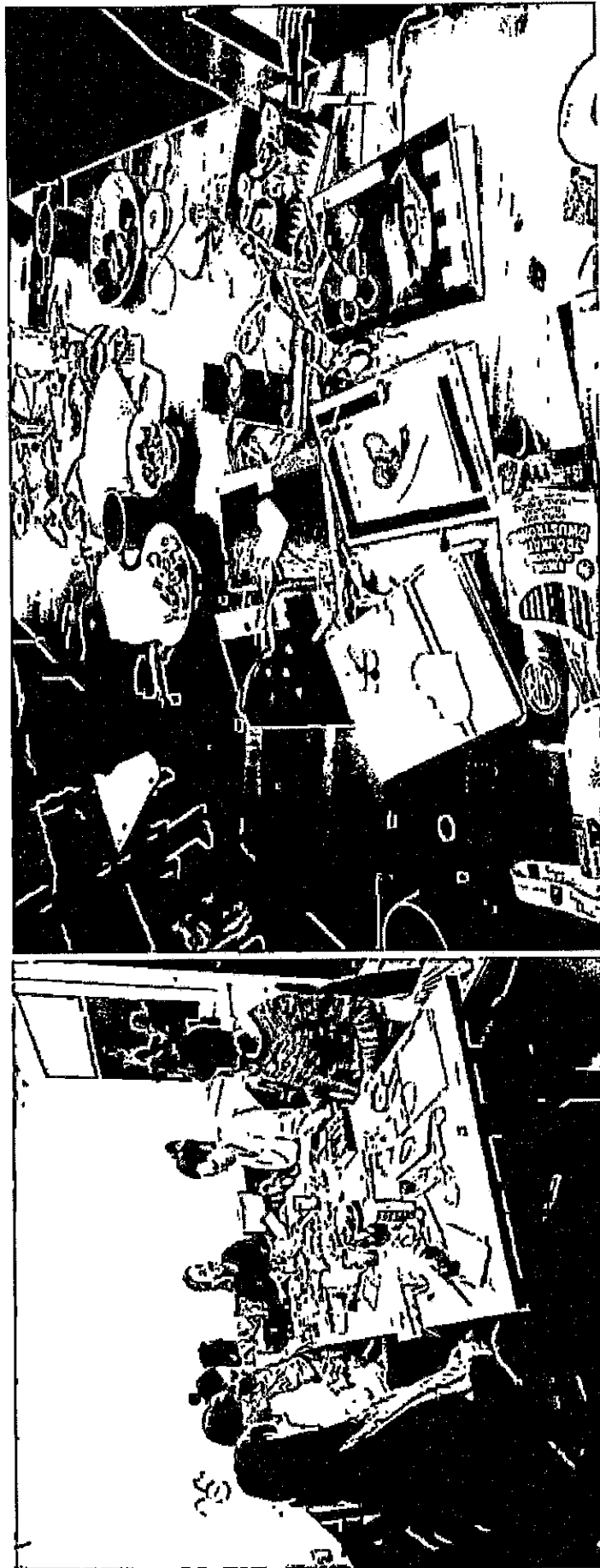
Grupa wsparcia pa. Mamy dla Mam.